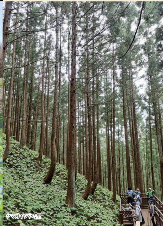
クマガイノウの里