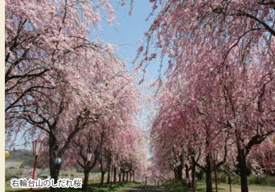
右輪台山のしだれ桜

●このパンフレットは、令和3年度ふくしま花回廊推進事業補助金の助成を受けて作成しています。