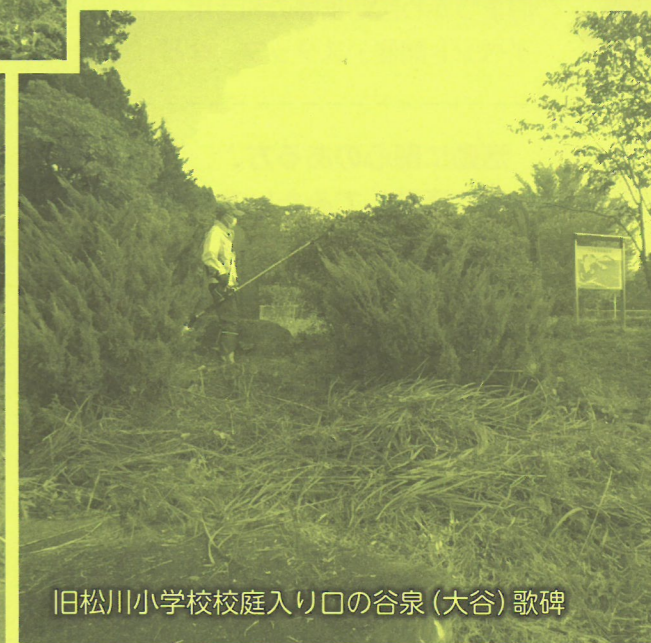
旧松川小学校校庭入り口の谷泉(大谷)歌碑