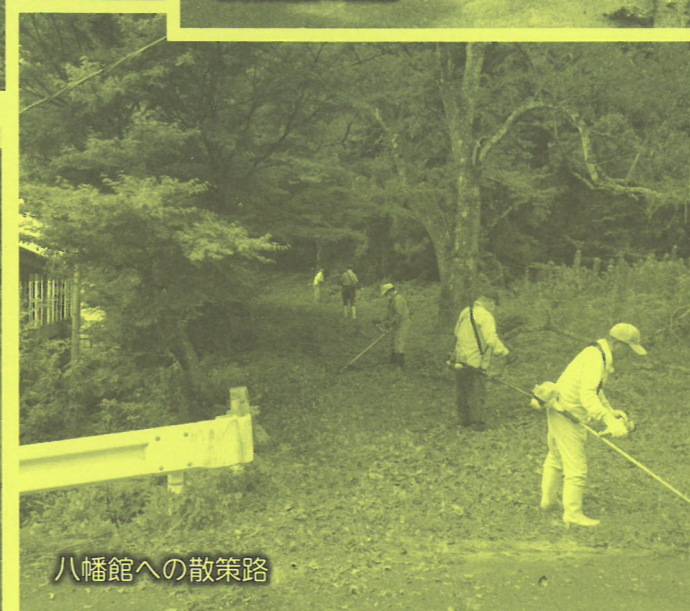
八幡館への散策路