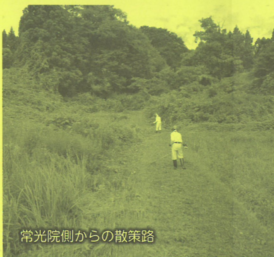
常光院側からの散策路