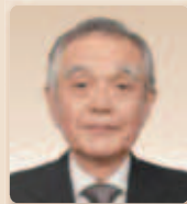
歴史の道土木遺産萬世大路保存会会長