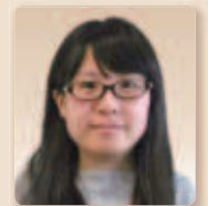
熊本県山都町教育委員会生涯学習課学芸員