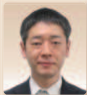
国土交通省福島河川国道事務所長