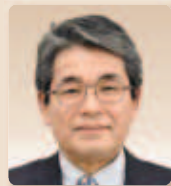
東北土木遺産研究所所長