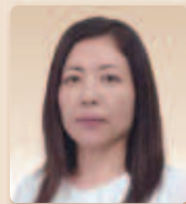
ふくしまけん街道交流会事務局