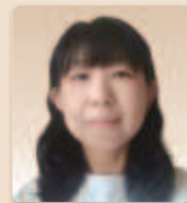
福島市立第一中学校教諭